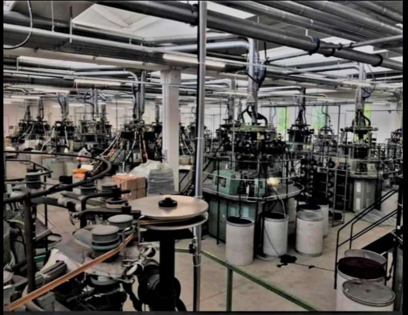
Круговые вязальные машины

На протяжении многих лет оборудование постоянно обновлялось в качественном и количественном отношении вплоть до нынешнего значительного количества из 40 круглых станков. Начиная с 2020 года оборудование будет оснащаться новой электроникой и системами управления. Структура и количество машин в вязальном цехе позволяют обеспечить высокую производственную мощность в короткие сроки.