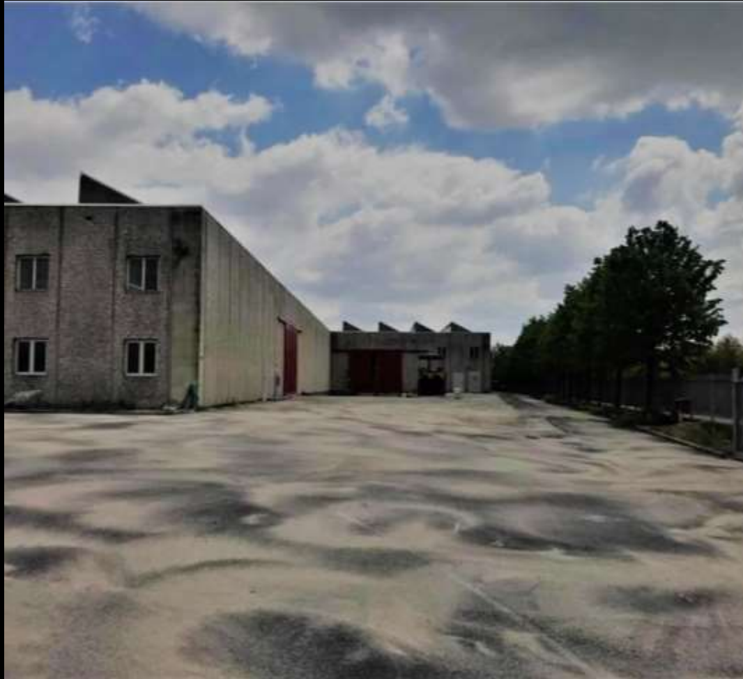
Техарел SpA– Производственный отдел

В начале девяностых годов он модифицировал свое оборудование текстильных круговых машин с помощью инновационной технологии отбитого волокна, получившей название “петля”. Такая технология была задумана и разработана внутри завода.