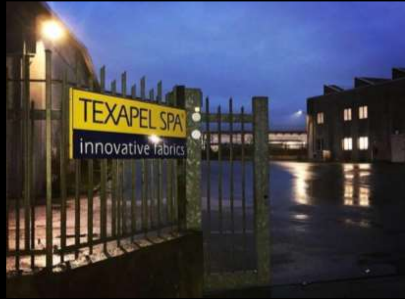
Texapel SpA – Оперативный склад

Он инвестировал в собственные текстильные отделы и разрабатывал коллекции тканей для одежды, мебели и обуви.